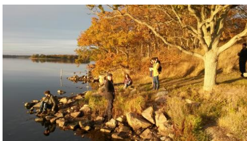
Yttre Park i väntan på linjefärjan