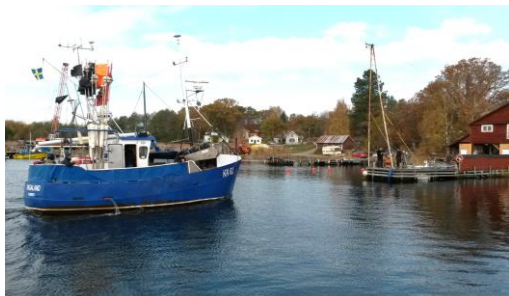
På väg in till Saxemara varv