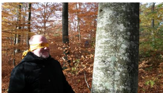
Ain från Estland känner sig fram till "sitt" träd