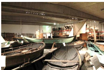
Blekinge museums magasin på Rosenholm i Karlskrona